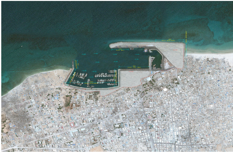
Naqshadii Ballaarinta Dekeda oo Mar kale La Bedelay.